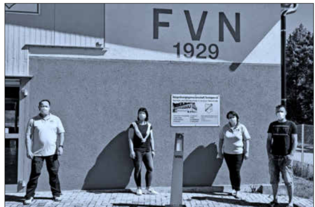
Mit Sicherheitsabstand wurde der Desinfektionsspender an den FV Nimburg übergeben.