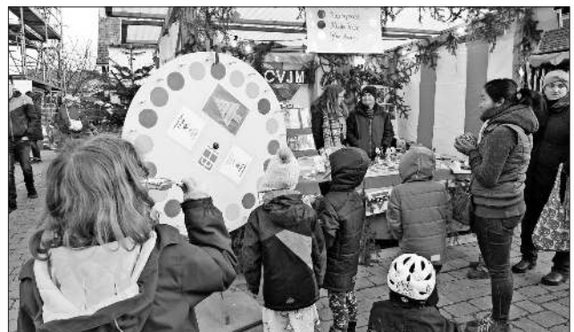
Kinderspaß am Glücksrad des CVJM.