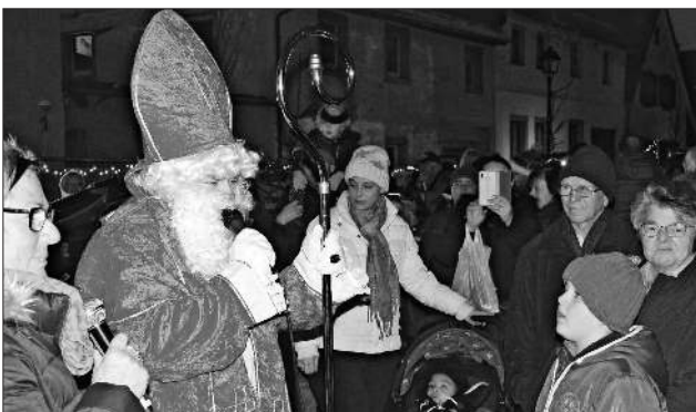
Der Nikolaus ist angekommen.

Am Sonntagnachmittag gehörte die Ziehung der Gewinner vom Weihnachtspreisrätsel des Gewerbevereins Teningen mit zu den Höhepunkten, bei dem es viele interessante Preise zu gewinnen gab. Zum Abschluss besuchte noch der Nikolaus, stilgerecht in einer Kutsche, den Weihnachtsmarkt, um die Gewinne der Weihnachtstombola zu verteilen.