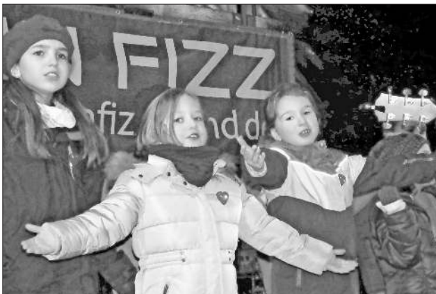
Singen macht den Kindern des Chors der Nikolaus-Christian-Sander-Schule viel Spaß.