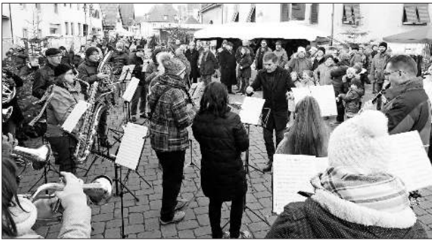
Die Musik- und Feuerwehrkapelle Teningen übernahm die musikalische Eröffnung.

Beton für den Innen- oder Außenbereich, Zinnfiguren und Schmuckkreationen - die Auswahl war enorm. Zudem konnte man seinen Lebensmittelvorrat mit selbst hergestellten Produkten wie Bienenhonig, Nudeln, Käse, Wurst oder Weihnachtsbrödle auffüllen.