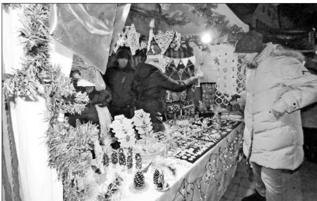
An den Marktständen gab es eine Fülle an Geschenkideen für den Besucher.