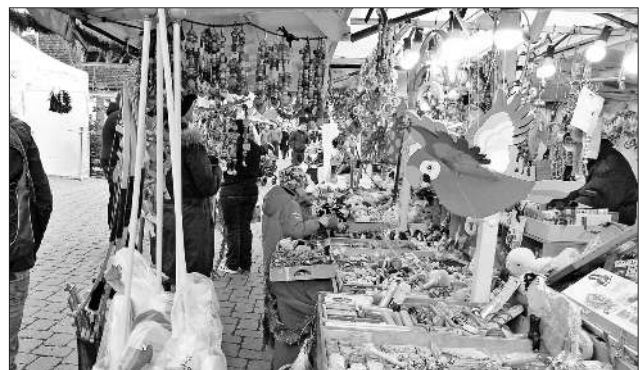
Holzspielzeug in allen Variationen.

dividierten sich die 53 Marktstände in diesem Jahr im Bereich der Engel-, Riegeler- und Kirchstraße und boten entsprechenden Platz zum Verweilen und zum Bummeln. Dazu rundete die große Bühne mit einem unterhaltsamen, musikalischen Rahmenprogramm an beiden Tagen die Veranstaltung ab. Egal, ob große oder kleine Besucher, für jeden Geschmack war etwas dabei. Suchten die Erwachsenen eher noch nach einer Geschenkidee, erfreuten sich die Kinder an der lebendigen Weihnachtskrippe im Bereich des Anwesen Menton, wo zusätzlich eine Bastelecke vom Kinder- und Jugendbüro Teningen eingerichtet war, oder an den Ständen mit unterschiedlichsten Süßigkeiten oder Spielzeug. Wer von den Erwachsenen noch auf der Suche nach ausgefallenen Geschenken war, konnte fündig werden. Ob Klassiker wie Staubwedel oder selbst hergestellte Seife, Figuren aus Papier gefertigt für das häusliche Regal, verschiedenste Holzarbeiten, Kunst aus