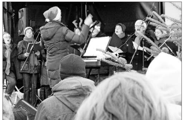
Chor Sing4fun aus Teningen sorgte für weihnachtliche Nachmittagsunterhaltung.