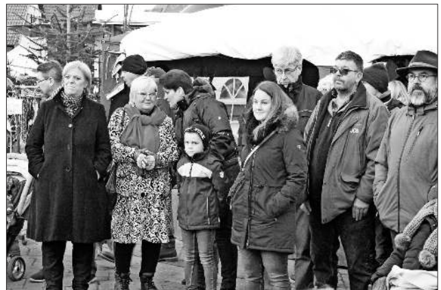
Alle warten auf die Eröffnung des Weihnachtsmarkts.