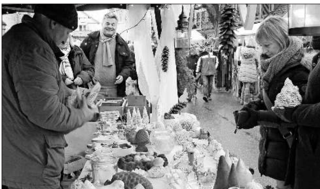
Steindeko für den Garten, immer wieder beliebt.