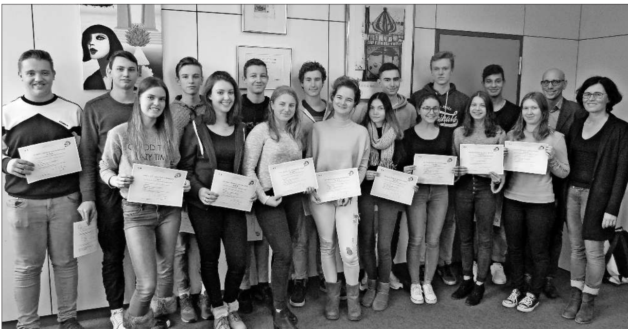
Die Schüler erhielten ein Zertifikat zur erfolgreich abgelegten DELF-Prüfung.