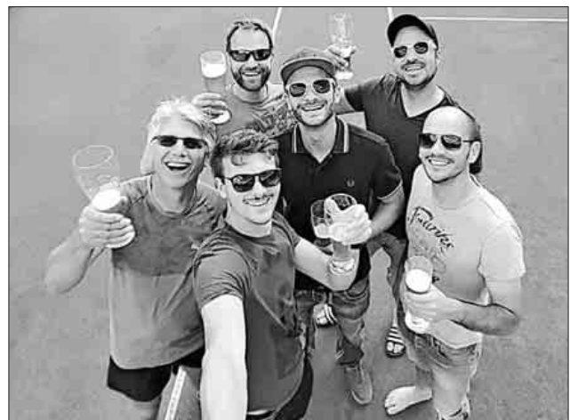
Sie haben sich ihr Bier redlich verdient und dürfen auf ihren Erfolg anstoßen. Das Herren-Team des Tennisclubs Heimbach nach dem erfolgreichen Hitzematch am Sonntag gegen Buchholz, dass man mit 6:3 für sich entscheiden konnte.

Fest steht allerdings, dass der Heimbacher Club in seinem Jubiläumsjahr noch einiges zu bieten hat. Am 28. Juli findet auf dem Court das Grümpelturnier statt, zu dem natürlich auch Besucher herzlich eingeladen sind. Ebenfalls stehen noch die Spiele der Mixed-Mannschaft im September an. Das Tennisjahr 2018 ist für den Club noch lange nicht zu Ende.