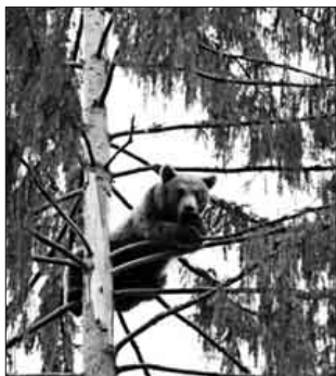
Bärin Jurka hat keine Mühe, auf eine Fichte zu klettern und genießt dabei die Aussicht im Wolf- und Bärenpark.