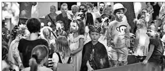
Die Kinder als Tiere verkleidet mitten im großen Schiff – dem Klettergerüst in der Villa Kunterbunt.

Unter dem Motto: „Es ist noch Platz in der Arche, komm steig mit uns ein“ wurde am vergangenen Sonntag Gottesdienst im Außengelände des Kindergartens gefeiert. Die Kinder gestalten zusammen mit der Gemeindediakonin, Frau Hagen, und den Erzieherinnen einen bunten, fröhlichen Gottesdienst. Als Tiere verkleidet zogen die Kinder nach und nach in „Noahs Arche“; gerade noch rechtzeitig vor dem großen Regen...! Beim anschließenden Kirchkafee genossen die großen und kleinen Gottesdienstbesucher den Schatten der alten Bäume. So ließ es sich gemütlich verweilen, schnabulieren und plaudern.