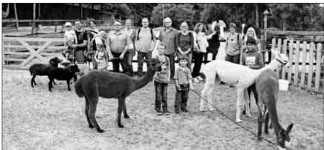
Ein Erlebnis der besonderen Art war für die Teningen Gäste eine Wanderung rund um den Bonifazhof mit Schafen, Ponys und Alpakas.