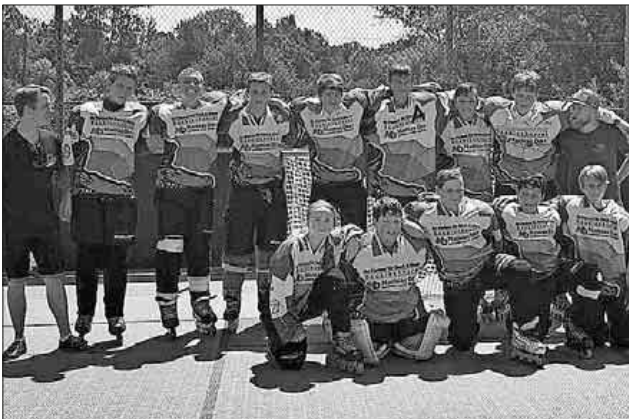
Die Spielgemeinschaft Nimburg/Sasbach holte einen Punkt gegen Merdingen.

Das nächste Spiel der Herren in Nimburg findet am kommenden Samstag, 7. Juli, um 17.30 Uhr am Hockeyplatz in Nimburg statt.