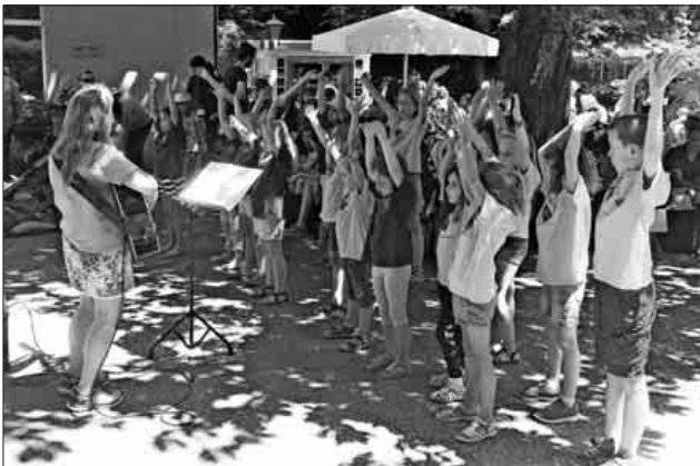
Die Kinder des Schulchors präsentierten einige Stücke vor einem begeisterten Publikum.

Bei der „Klingenden Mainau“ handelt es sich um eine Veranstaltungsreihe des Ministeriums für Kultus, Jugend und Sport sowie des Landesinstituts für Schulsport, Schulkunst und Schulumusik Baden-Württemberg mit dem Europäischen KulturForum Mainau und der Stiftung „Singen mit Kindern“.