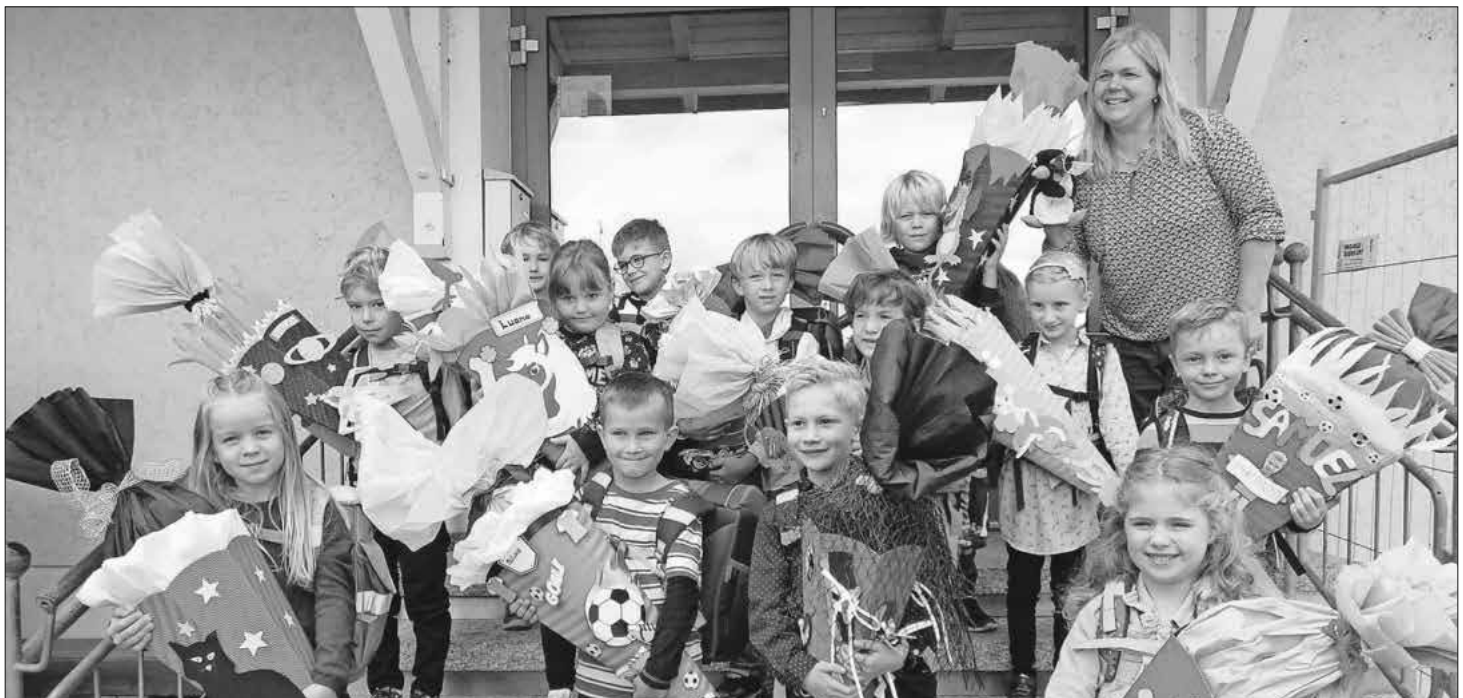
Die frischgebackenen Erstklässler bei der Einschulung.

Die Schulleitung wünscht allen Kindern und Eltern einen guten Schulstart und freut sich auf ein tolles, gemeinsames Schuljahr.