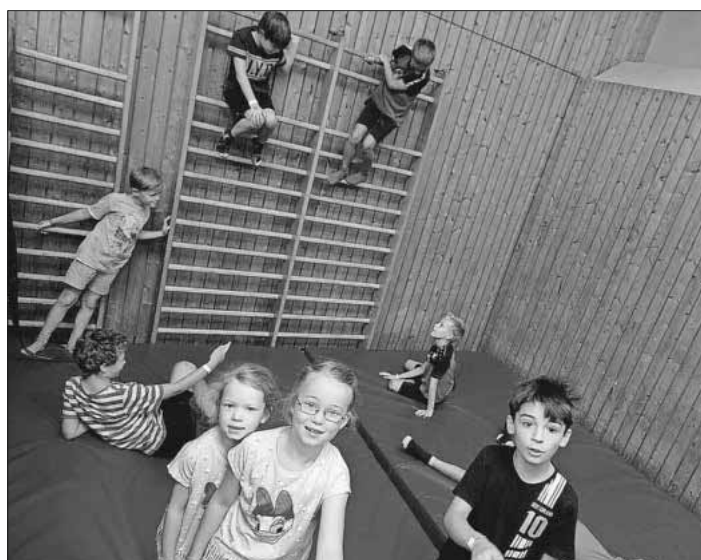
Die Kinder hatten viel Spaß im Ferienprogramm.

Infos zur Arbeit von SpoFunnis sowie Anmeldung zu aktuellen Aktivitäten sind möglich unter spuero@spofunnis.de sowie unter 07641 / 9379999. Weitere Informationen sind zu finden auf www.spofunnis.de .