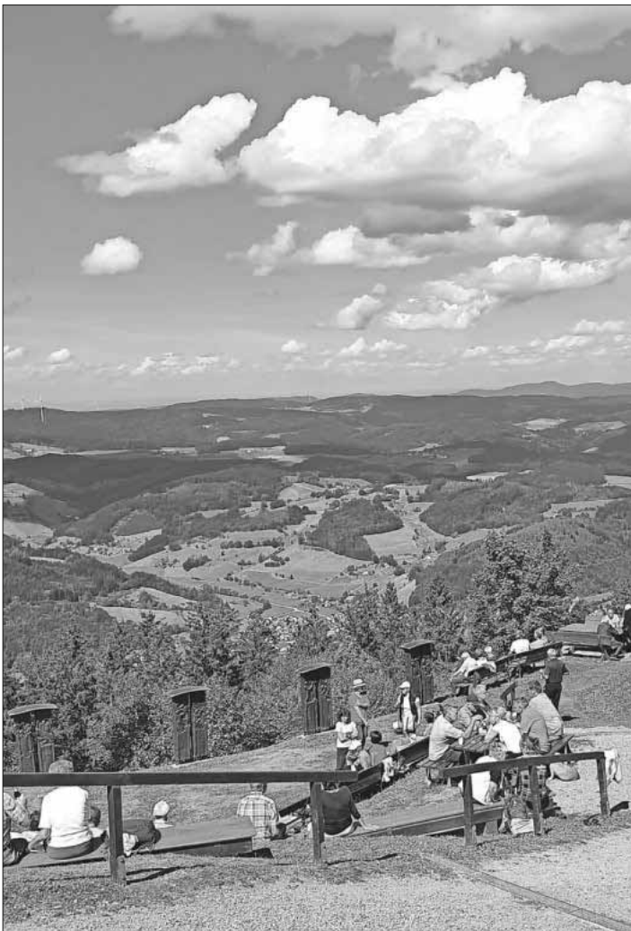
Eine wunderschöne Aussicht