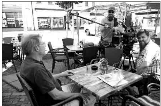
Das SWR 3-Fernsehen interviewte den Ganzjahresbarfußler.

Die Sendung wurde im Rahmen der „Landesschau“ am vergangenen Donnerstag ausgestrahlt und ist auch in der Mediathek des Senders abrufbar.