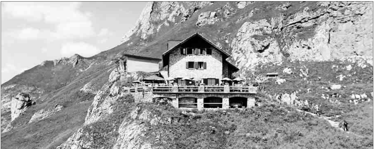
Die Bad Kissinger Hütte.