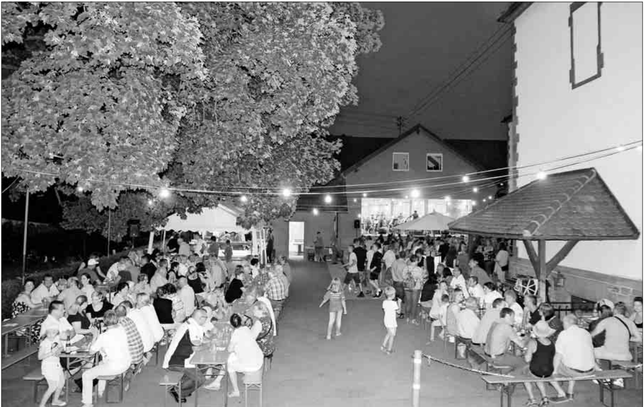
Das Sommernachtkonzert der Winzerkapelle Ködringen war sehr gut besucht.

die Zuhörer auch emotional anspricht. Mit einer 80er Kulttour mit Songs der neuen Deutschen Welle kam so manche Erinnerung an „Falco“ oder auch die „Spider Murphy Gang“ auf, bevor mit dem „Doppeladler“ ein wunderschöner musikalischer Sommerabend endete. Natürlich nicht ohne eine Zugabe, die dann auch noch von Sängerin Becker gesanglich beim Stück „Minnie the Mocher“ reizvoll den musikalischen Teil des Abends beendete.