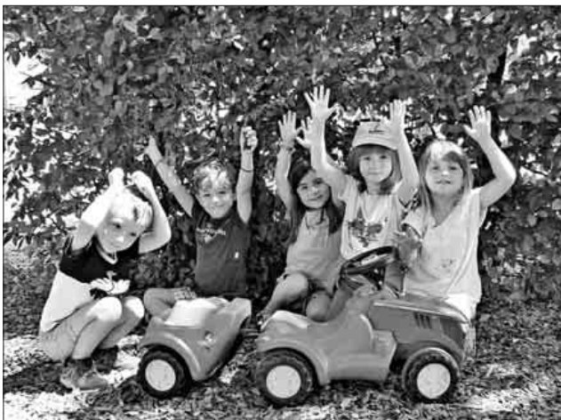
Die Kinder freuten sich über den Bobby Car Traktor.

Mit Freude haben die Kinder der Villa Kunterbunt den Bobby Car Traktor entgegengenommen. Das Geld kam durch den vom Elternbeirat der Villa Kunterbunt organisierten Kuchenverkauf im April vor dem Edeka Kohler zusammen. Ganz besonders die Minis, aber auch die großen Kinder, bedanken sich ganz herzlich bei allen Kucheneinkäufern.