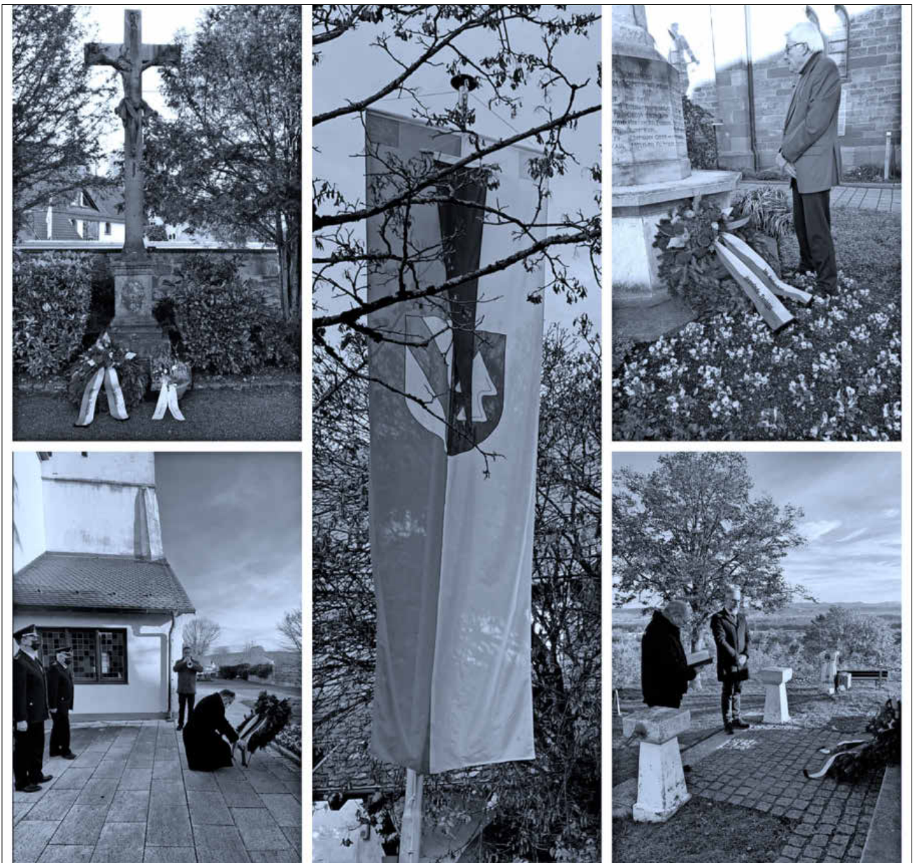
Impressionen vom Volkstrauertag.

So konnte der Volkstrauertag auch 2020 angepasst, dennoch würdig und dem Anlass entsprechend, trotz der Pandemie, begangen werden.