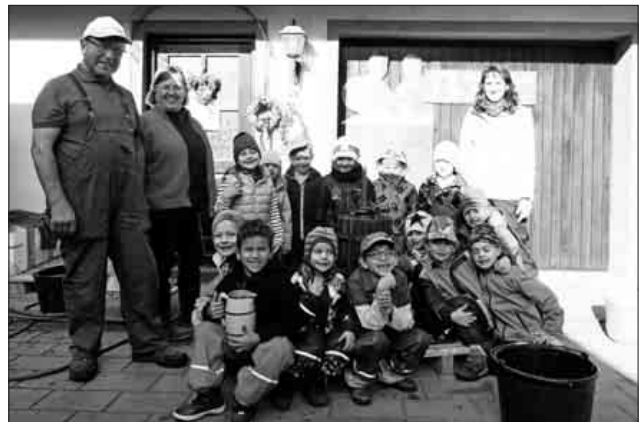
Nach einem lehrreichen Tag durften die Kinder den frisch gepressten Apfelsaft probieren.