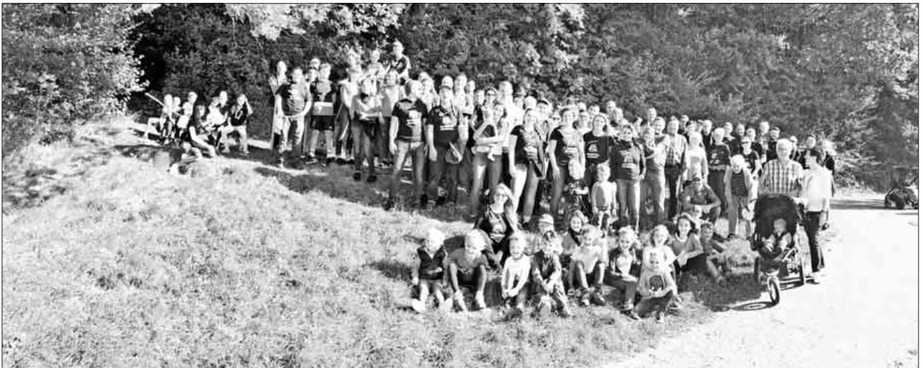
120 Waldteufel nahmen am diesjährigen Helferfest teil.

Gestärkt ging es weiter Richtung Ramstalhof, wo ein leckeres Buffet auf die Waldteufel wartete. Später spielte die Band: ON AIR, die bis in die frühen Morgenstunden für Stimmung sorgte.