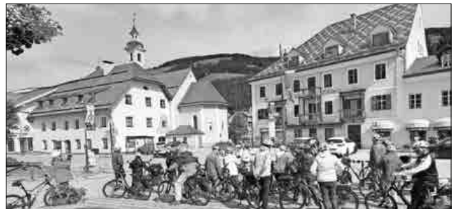
Die Radgruppe in Toblach.

Die teils stärker geforderten Wanderungen führten in die Dolomiten. Die Dolomiten gehören zu den schönsten Berglandschaften der Alpen. Die Formen der Kalksteinfelsen gelten als weltweit einzigartig. Dies konnte man bei der Drei-Zinnen-Rundwanderung hautnah erleben. Mit der nächsten und letzten Wanderung auf dem Kronberg auf 2.275 Metern war dazu die schönste Aussicht in die umliegenden Täler und Berge gegeben. Mit dem schönen Wetter und den interessanten Touren ging wieder einmal eine der traditionellen Wanderwochen des Schwarzwaldvereins zu Ende.