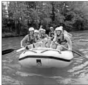
Rafting in Slowenien.

In den Sommerferien gab es nur zwölf Tage inklusive der Wochenenden, an denen SpoFunnis – der Sport-, Fun und Erlebnisclub der SG Köndringen-Teningen – kein Programm durchführte. An den anderen 34 Tagen waren die knapp 150 Mitarbeitenden mit über 150 verschiedenen Teilnehmenden unterwegs in Südbaden, Deutschland und einigen südeuropäischen Ländern oder luden zum Hallenferienprogramm Sport&Fun ein. Der Start erfolgte am 30. Juli mit der Anreise der Mitarbeitenden zum Erlebniscamp am Ruhrberg in Grenzach-Wyhlen bei Lörrach. Trotz nicht optimalen Wetters konnten mit den acht- bis 13-jährigen Teilnehmenden eine Reihe von unterhaltsamen und abwechslungsreichen Aktivitäten unternommen werden. Auf dem Programm standen ein Fußball-Schlamm-Turnier, der traditionelle Wettkampf „Schlag den Mitarbeiter“ (welchen zum ersten Mal die Teilnehmenden gewinnen konnten), verschiedene Ausflüge in die Umgebung sowie der Galaabend mit viel Tanz und Musik. Gekocht wurde in Kleingruppen, sodass alle Beteiligten zumindest einmal in der Küche hinter dem Herd standen. Das Essen war exzellent!