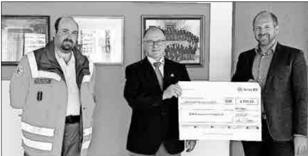
Spendenübergabe der Netze BW an den DRK Ortsverein Teningen.