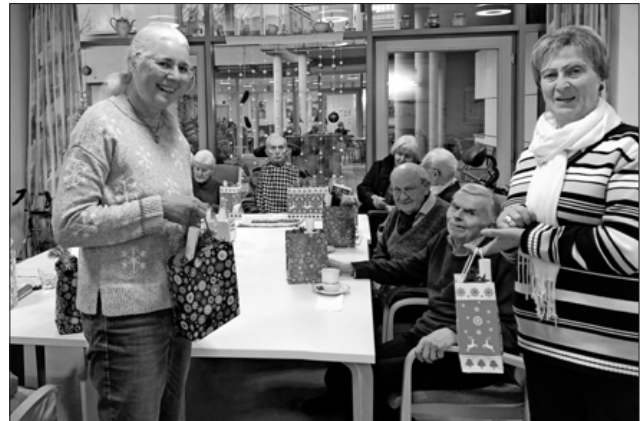
Weihnachtstüten der AWO für die Bewohner des Pflegeheims.