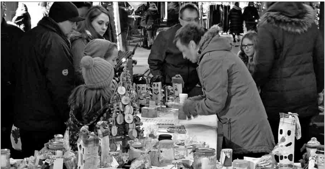
Am Stand vom Kindergarten Sonnenschein gab es Selbstgebasteltes.