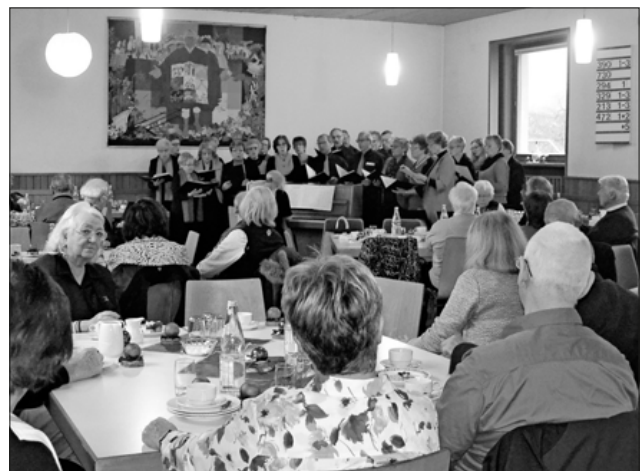
Der gemischte Chor der Chorgemeinschaft Nimburg unterhielt die Besucher des Gemeindegemeinschaftsmittags mit einigen Weihnachtsliedern.