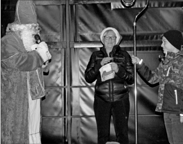
Er durfte dem Nikolaus bei der Verlosung helfen.