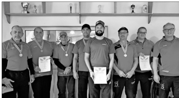
Die Teningen Schützen konnten auch dieses Mal zahlreiche Medaillen gewinnen.

Die Kreismeisterschaft ist gleichzeitig die Qualifikation zur Landesmeisterschaft, welche Ende Januar in Villingen stattfindet. Allen Qualifizierten wünscht der BSV hierfür „Alle ins Gold“.