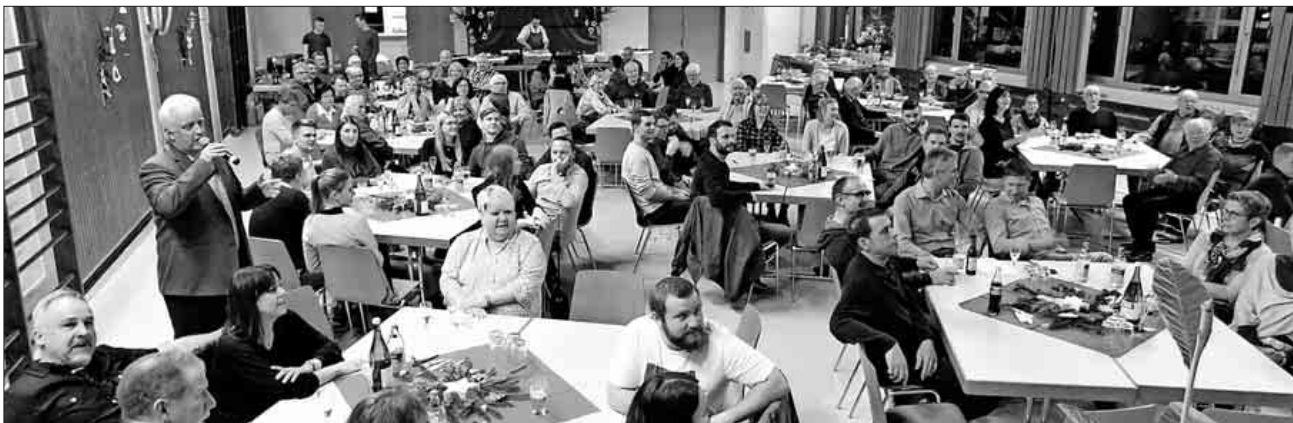
Trotz Terminüberschneidungen besuchten einige Anhänger des SV Heimbachs die Weihnachtsfeier.