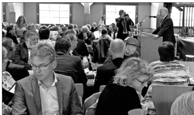
Bundestagsabgeordneter Peter Weiß sprach sich für die Europäische Union aus, auch als Garant des Friedens.