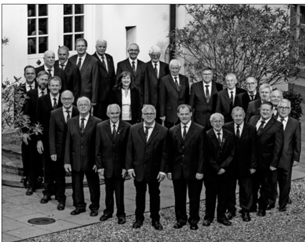
Der Männerchor Heimbach

Einblicke in die Aktivitäten des Chores und weitere Informationen findet man auch unter www.maennerchor-heimbach.de