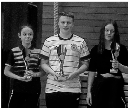
Auch drei Jugendliche aus der U18-Gruppe gewannen einen prächtigen Pokal.

Alle teilnehmenden Kinder und Jugendlichen kämpften bei den Vereinsmeisterschaften der Jugend des TTC Nimburg am zweiten Januarsamstag in der Nimberghalle mit Begeisterung und Eifer um den Sieg. Zwei Altersgruppen traten gegeneinander an: Die Spielerinnen und Spieler der U15 und der U18. Zur