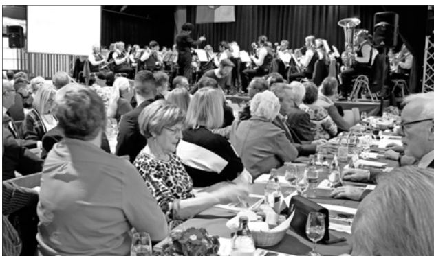
Die Winzerkapelle Köndringen lockerte das Programm musikalisch auf.