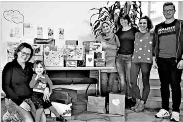
Unter dem Motto „Freude im Schuhkarton“ spendeten die Dreikäsehochs Kleidung und Spielsachen an die Waisenhausstiftung, Abteilung „BiFF“.

Um die Organisation noch weiter am Leben erhalten zu können, freut man sich über jede Spende an die Abteilung „BiFF“. (Spendenkonto der Heiliggeistspitalstiftung, IBAN: DE08 6805 0101 0013 8769 15, BIC: FRSPDE66XXX, Verwendungszweck: „BiFF - Bildung spendet Hoffnung“)