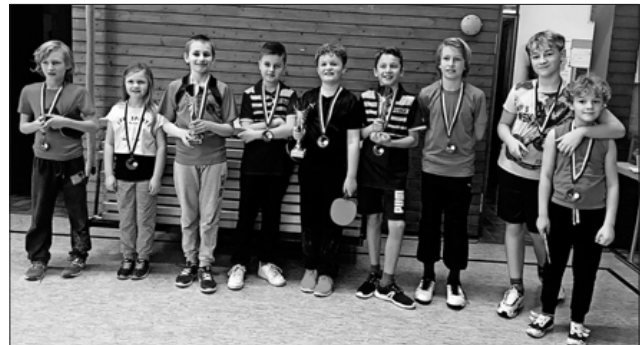
Die Siegergruppe der U15

Jugendlichen nicht nur ein gutes Training geboten, sondern auch Geselligkeit, Spiel und Spaß. Neue Interessierte sind jederzeit willkommen.