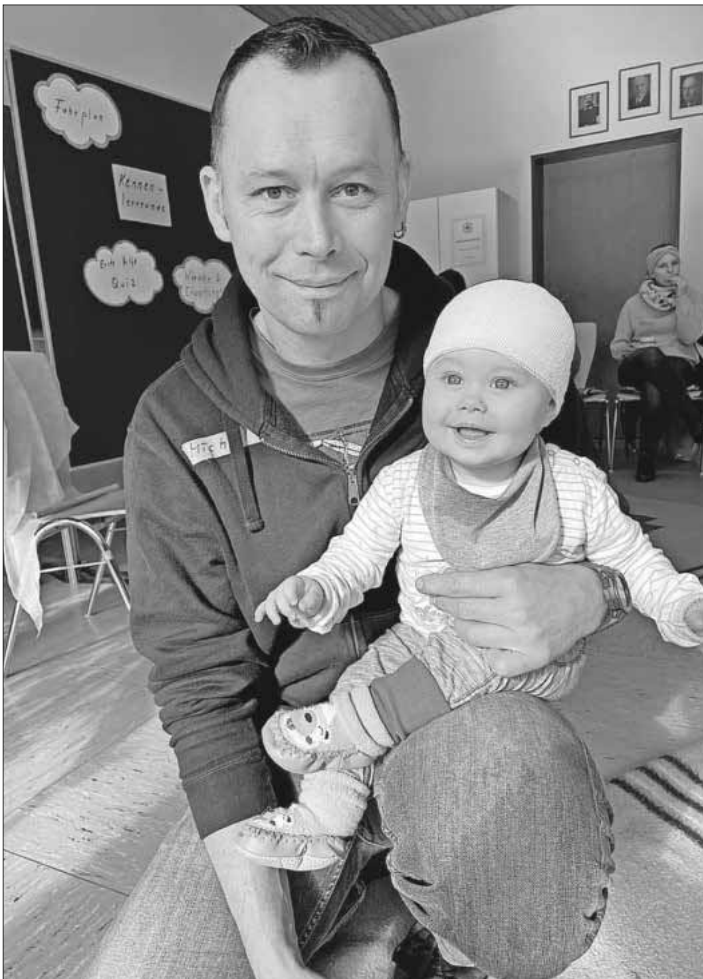
Erwachsene und auch Kinder sind beim Kindernotfallkurs herzlich willkommen.

Das Teningen Rote Kreuz bietet in Kooperation mit der Volkshochschule Emmendingen am Samstag, 17. Februar, von 9 bis 13 Uhr einen Kindernotfallkurs an. Seminarleiter Kurt Armbruster unterrichtet, was in einem Notfall zu tun ist: wenn sich ein Kind zum Beispiel verletzt, blutet und Schmerzen hat oder wenn es sich verbrüht oder einen Fremdkörper verschluckt hat. Zielgruppe sind Eltern, Großeltern, Erzieher, Tagesmütter, Babysitter und alle anderen Personen, die Kinder betreuen. Anmeldungen sind möglich unter Telefon 07641 / 92250 sowie per E-Mail an info@vhs-em.de oder im Internet unter www.vhs-em.de .