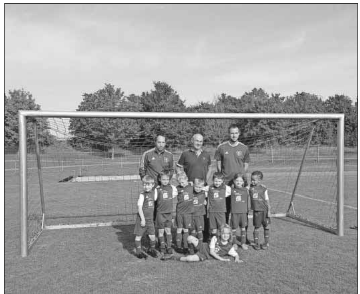
Die G-Jugend-Mannschaft in ihren neuen Trikots.