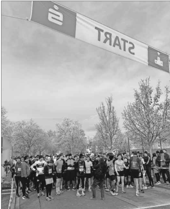
Kurz vor dem Start zum Zehn-Kilometer-Lauf.