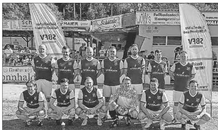
Mannschaft FV Nimburg.

Auch im Liga Modus steht die AH auf Platz 1 der Tabelle und kann mit einem weiteren Sieg das Halbfinale klar machen.