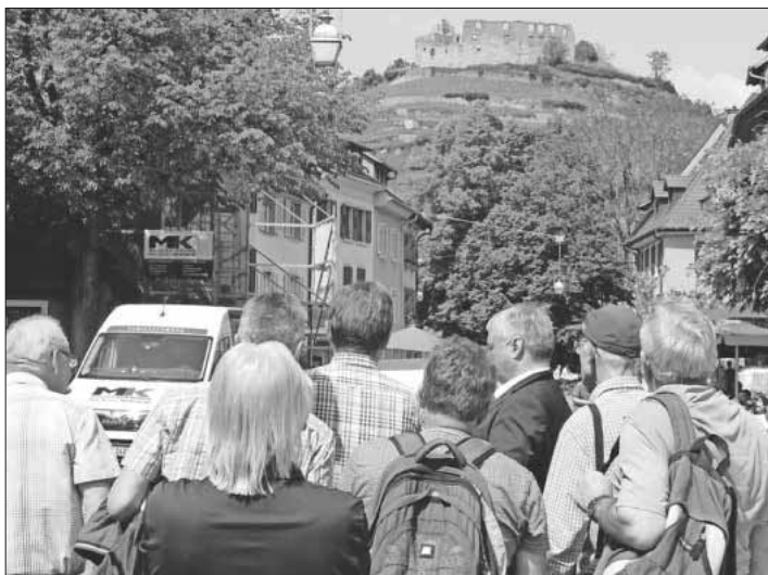
Das Ausflugsteam „Rasenmäher-Gang“.