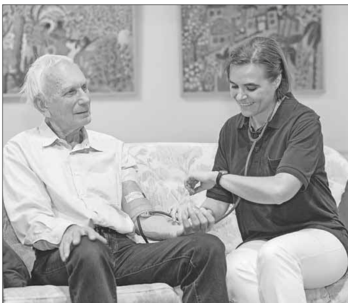
Mit Menschen arbeiten macht Freude: Eine Pflegekraft der BruderhausDiakonie misst den Blutdruck.