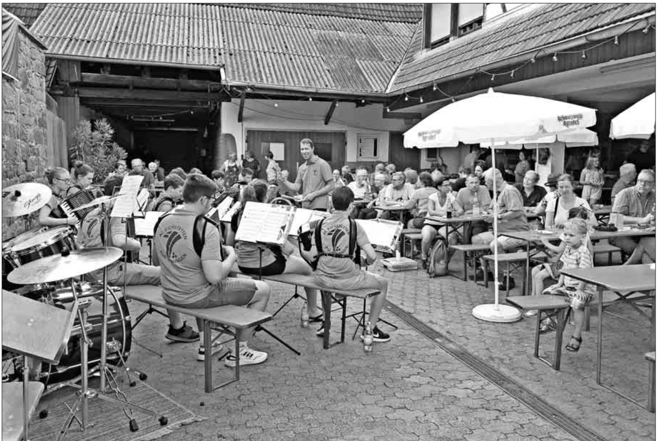
Das Jugendorchester der Akkordeonspielgemeinschaft Teningen.

Einige Gäste „flüchteten“ vor dem Regen, die Mehrzahl allerdings blieb und genoss den rundum gelungenen Abend.