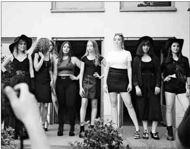
Stilsicher und elegant führten die Mädchen eine Modenschau bei der Projekt Party durch.