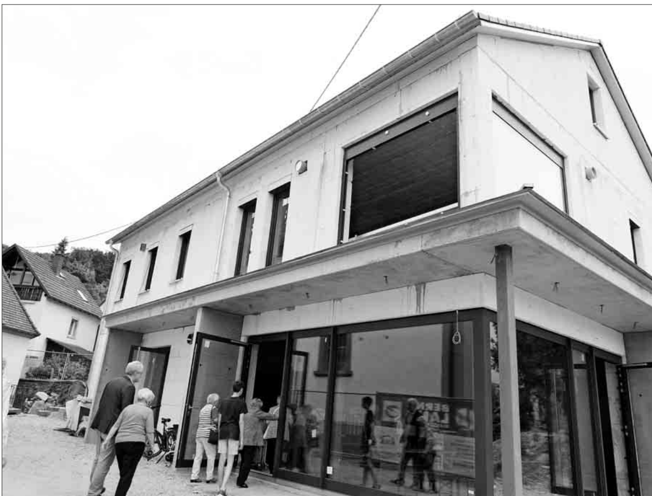
Der Rohbau ist fertig.

Laut Rudi Hügler vom Pfarrgemeinderat und Bauausschuss soll das neue Gemeindehaus ein neuer Mittelpunkt der Begegnung für ganz Heimbach werden. Inwieweit nach Vollendung im Frühjahr des kommenden Jahres die Räumlichkeiten auch für Festlichkeiten zur Verfügung gestellt werden können, muss auch mit Rücksicht auf die Nachbarschaft noch geklärt werden.