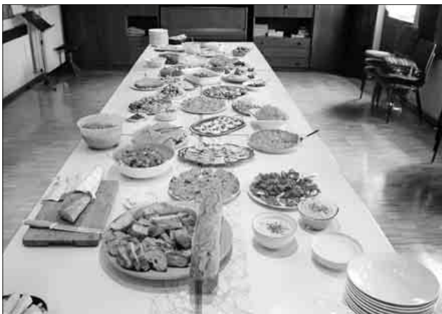
Der Kreis „Der etwas andere Gottesdienst“ richtete ein reichhaltiges Buffet an.