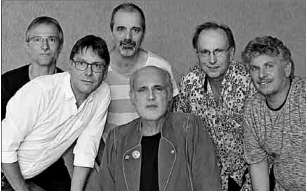
Die Band „Andromeda“.

Für kühle Getränke ist gesorgt! Der Eintritt ist frei – über Spenden freut sich der Kulturverein! Bei Regen findet die Veranstaltung im Gemeindesaal an der Burg statt.