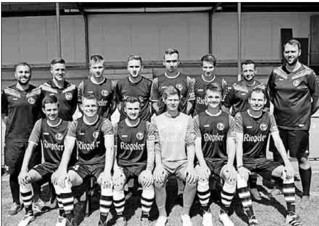
Gruppenfoto der Neuzugänge.