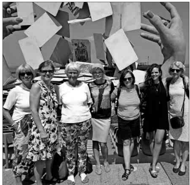
Die Teilnehmer waren sichtlich begeistert.