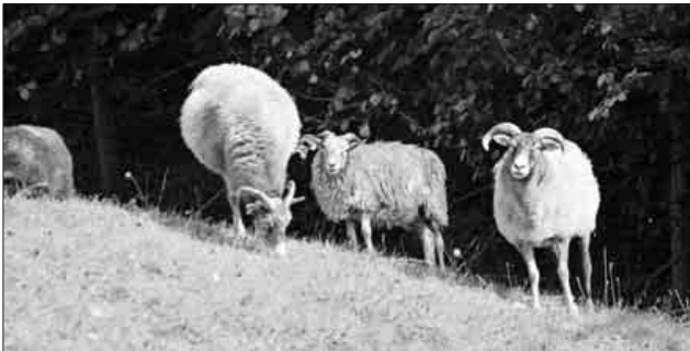
Auch Schafe fühlen sich sichtlich wohl auf der Viehweide.