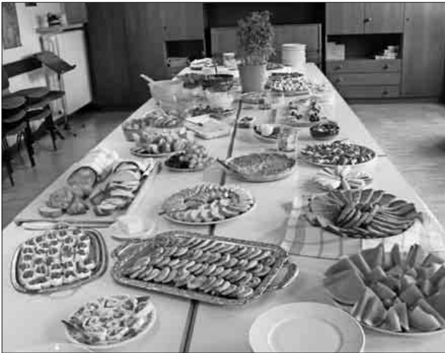
Ein üppiges Büfett.

Im Anschluss an den bereichernden Gottesdienst bot das Team alternativer Gottesdienste im Pfarrgarten einen gemeinsamen Brunch für alle Gottesdienstbesucher an, was von vielen angenommen wurde. Das Büfett war üppig mit salzigen und süßen hausgemachten Spezialitäten bestückt und es wurde sogar gegrillt. Im lauschigen und angenehm schattigen Pfarrgarten fand der Friedensgottesdienst einen geselligen Abschluss.