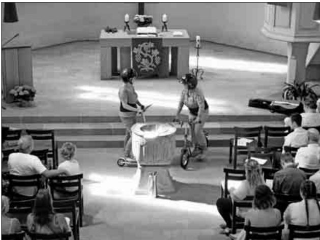
Alternativer Gottesdienst in der Bergkirche Nimburg.