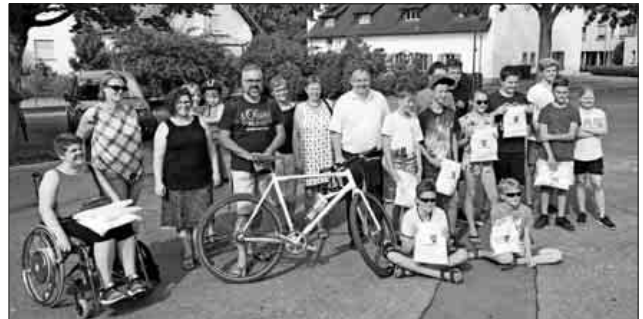
Krönender Abschluss, die Prämierung der aktivsten Teams.

Die meisten geradelten Kilometer je Teilnehmer verzeichnete das Team der Ökologisch Liberalen Liste mit 385 Kilometern je Teilnehmer, gefolgt vom Team Frako mit 336 Kilometern je Teilnehmer und dem Team Köhler mit 257 Kilometern je Teilnehmer.