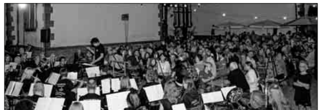
Köndringer Sommernacht vor dem Haus der Musik.