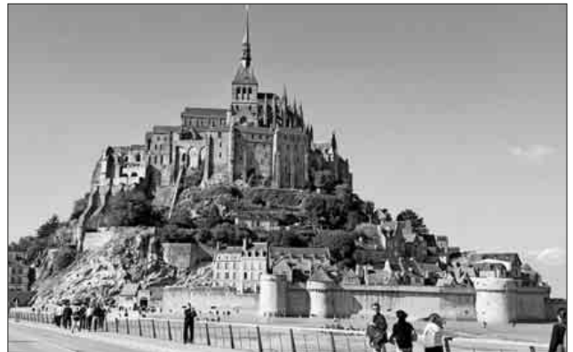
Der Mont-Saint-Michel und seine Bucht gehören seit 1979 zum Unesco-Kulturerbe.