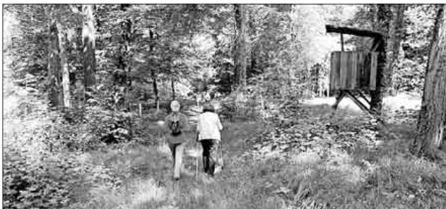
Eintauchen in das Grün des Teningen Allmendwaldes und dabei den Alltag vergessen.

Fit in den Herbst: Das „Gesundheitswandern“ des DRK-Ortsvereins Teningen erfreut sich einer großen und steigenden Beliebtheit. Gerade jetzt lädt der Herbst zu ausgedehnten Touren ein. Gesundheitswandern verbindet das Naturerlebnis Wandern mit ausgewählten Übungen für Koordination, Kraft, Ausdauer und Entspannung an schönen Plätzen in der Teningen Allmend. Die Teilnehmer genießen dabei die Natur, lassen die Seele baumeln und haben Spaß mit Gleichgesinnten. Das Teningen Rote Kreuz bietet in Kooperation mit der VHS ab Dienstag, 1. Oktober, fünfmal von 9.30 bis 11.30 Uhr Gesundheitswanderungen unter dem Motto „Bewegung ist die beste Medizin“ an. Verbindliche Anmeldung unter Telefon 07641 / 92250. Treffpunkt: Parkplatz Trimm-dich-Pfad, Teningen Allmend.