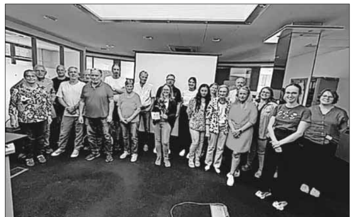
Die Teilnehmer des Aufbauseminars.