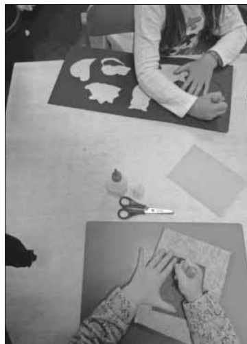
Kindergartenkinder beim Laternenbasteln in Vorbereitung auf St. Martin.

Im Kindergarten beschäftigte man sich mit den Kindern rund um das bevorstehende Fest des Heiligen Martin. Die Schulanfänger übten ein St. Martinsspiel als Rollenspiel mit Instrumenten ein, Laternen wurden gebastelt, Laternenlieder gesungen und die Erzählung über das Wirken des Heiligen Martins mit Bilderbüchern und Kamishibai den Kindern altersgerecht weitergegeben. Der Herbst in seinen bunten Farben lud ein zu verschiedenen Basteleien mit Naturmaterialien, zum Beispiel Kastanienketten, Blätter sammeln und pressen, etc. Natürlich war auch die Heimbacher Kilwi präsent bei den Kindern. Hauptsächlich beschäftigt die Kinder aktuell das Thema „Fußball“: Das Fußballtraining der Heimbacher „Bambinis“ und den anstehenden Fußballturnieren und die