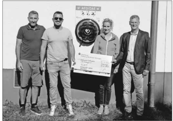
Große Freude beim FV Nimburg über den Defibrillator.

Der FV Nimburg verfügt ab sofort über einen automatisierten und öffentlichen Defibrillator AED/DAE. Dieser wurde vor kurzem an der Vorderfassade des Vereinsheims angebracht und ist rund um die Uhr für jedermann zugänglich. Der Defibrillator wurde von der Sparkasse Emmendingen und einem unbekannten Spender aus Nimburg finanziert, wofür sich der FV Nimburg nochmal herzlich bedanken möchte. Das Gerät ist über den Verein „Region der Lebensretter“ in das App-basierte System integriert, mit dem die Rettungsleitstelle Emmendingen, registrierte Ersthelfer über Smartphone in der unmittelbaren Nähe des Notfalls orten und alarmieren können. Diese professionellen Retter, die in den ersten drei bis fünf Minuten nach einem Herz- Kreislaufstillstand eintreffen, können die Überlebenschance von Patienten verdoppeln bis vervierfachen. Eine echte Überlebenschance haben Patienten nach einem Herz- Kreislaufstillstand, wenn umgehend mit lebensrettenden Maßnahmen begonnen wird. Eine Schulung und Einweisung des Defibrillator ist für Interessierte und Mitglieder des FV Nimburg ebenfalls geplant.