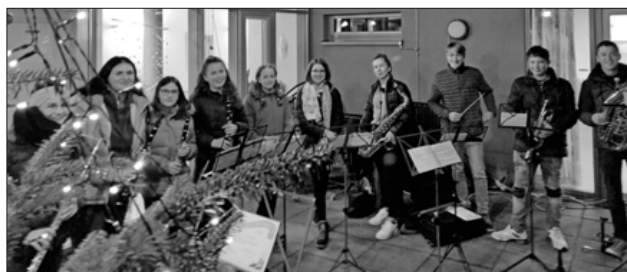
Jugendorchester umrahmt den Weihnachtsmarkt der Bruderhaus Diakonie mit Weihnachtsliedern.

Bei weihnachtlicher Atmosphäre im Innenhof der Bruderhaus Diakonie in Teningen hat das Jugendorchester der Musik- und Feuerwehrkapelle Teningen am Freitagabend den kleinen Weihnachtsmarkt mit vielen altbekannten Weihnachtsliedern musikalisch umrahmt. Die Besucher und Zuhörer wurden von oben, dem Balkon mit schönen Klängen beschallt und konnten bei Stücken wie „O du Fröhliche“ oder „Alle Jahre wieder“ besinnlich mitsingen. Die Lieder kamen sichtlich sehr an und wurden mit viel Applaus gewürdigt. Nach dem Auftritt konnten sich die Jungmusiker stärken mit heißer Wurst, Crêpes und Kinderpunsch. Für den nächsten Tag brauchten sie viel Energie, denn am Samstag ging das Jugendorchester in den Europapark nach Rust.