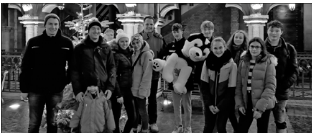
Die Jugendkapelle der Musik- und Feuerwehrkapelle Teningen im Europa-Park in Rust.

Informationen zur Musikalischen Ausbildung der Musik und Feuerwehrkapelle Teningen findet man unter www.mfk-teningen.de .