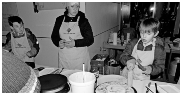
Auch am Crêpes-Stand halfen die Schülerinnen und Schüler.