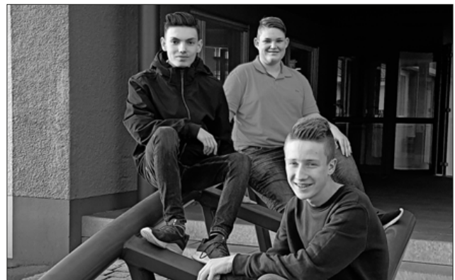
Drei Schüler der 9. Klasse durften für ihre Projektprüfung die Werkhallen von Mack Rides besuchen.

Die Nikolaus-Christian-Sander-Schule bedankt sich herzlich bei der Firma Mack Rides für die tolle Betreuung vor Ort bei diesem ungewöhnlichen Einblick in die Welt des Achterbahnbaus.