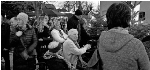
Die Bewohner waren mit viel Spaß und Freude dabei.