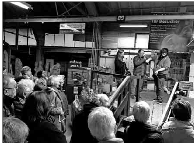
Glasblasen in der Dorotheenhütte beim AWO-Ausflug.

An dem vom AWO-Ortsverein angebotenen Busausflug haben 20 Seniorinnen und Senioren aus Teningen und Köndringen teilgenommen. Ziel war die Dorotheenhütte in Wolfach im Kinzigtal. Die Busfahrt führte auf kurvenreichen Straßen durch den Schwarzwald mit teilweise noch schöner Herbstfärbung. Am Ende der Fahrt setzte heftiger Regen ein. Man musste fürchten, dass das geplante Bratwurstessen im Schlosshof ins Wasser fallen würde. Aber zunächst stand die Besichtigung der Glashütte an. Alle lauschten aufmerksam der Führung. Die Dorotheenhütte ist die einzige Mundblashütte, die im Schwarzwald noch in Betrieb ist. Es wird hier ausschließlich das schwere, hochwertige Bleikristall verarbeitet, mit moderner Ofentechnik mit Wärmerückgewinnung. Das Highlight war, dass einer der Teilnehmer seine eigene Vase blasen durfte. Nachdem alle genug gesehen hatten, traf man sich im Cafe. Der Regen hatte inzwischen nachgelassen, so dass man entschied, im Wolfacher Schlosshof den gemütlichen Adventsmarkt der Landfrauen zu besuchen und diejenigen, die sich auf ihre Bratwurst gefreut hatten, wurden nicht enttäuscht. Dies war der „Einstand“ des neuen AWO-Vorstands. Alle waren zufrieden und versprachen, Werbung zu machen, damit man beim nächsten Ausflug einen großen Bus nehmen kann. Das Angebot richtet sich an die Bewohner aller Teningen Ortsteile.