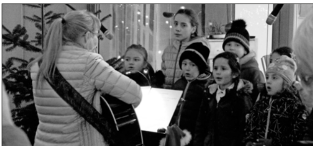
Der Schulchor erfreute die Besucher mit weihnachtlichen Liedern.