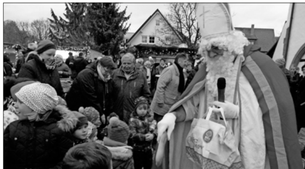
Wie könnte es anders sein, mit leuchtenden Augen wurde der Nikolaus empfangen.