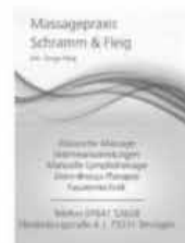
Massagepraxis Schramm & Fleig